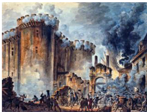
Der Sturm auf die Bastille am 14. Juli 1789