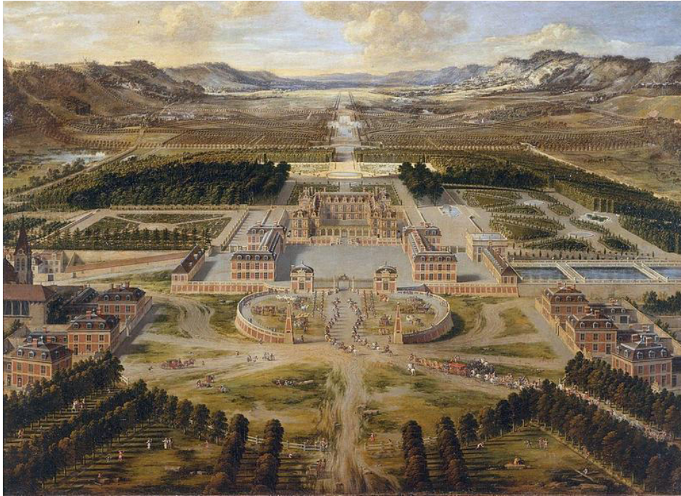
Abbildung 1 Gemälde von Pierre Patel